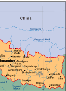
lungo 6500 Km in Nepal)